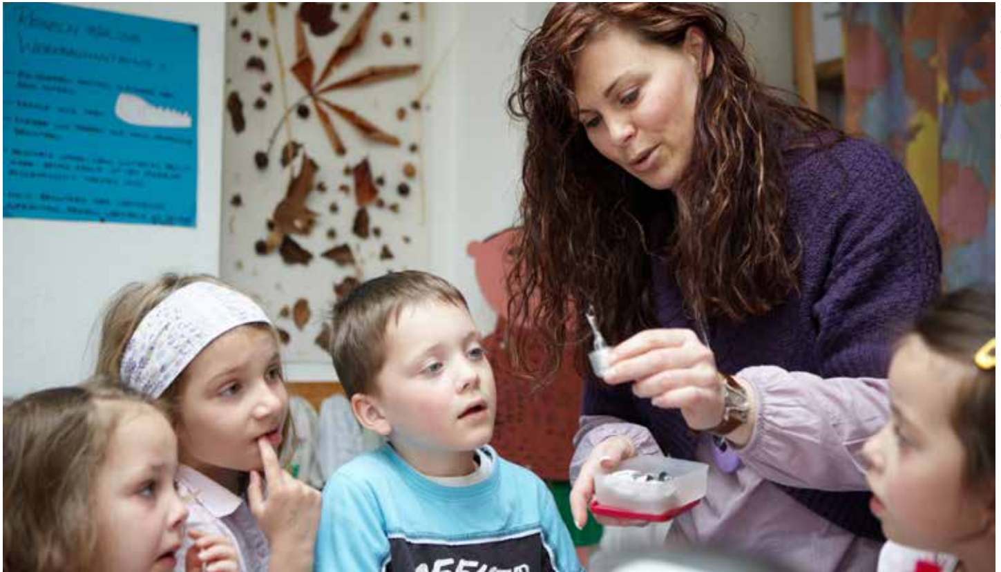
Bildung für nachhaltige Entwicklung in der Praxis: Die Erzieherin geht mit ihren Kita-Kindern Fragen zu Energie und Umwelt auf den Grund.

für ökologische, soziale und ökonomische Prozesse diskutiert werden können (BMBF 2009: 6f.). Diese Themen sind zudem anschlussfähig an den Alltag der Menschen.