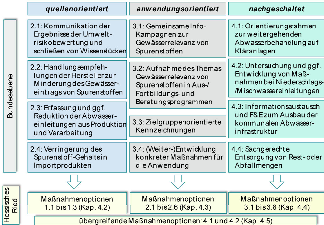
Abb. 5–1: Bezug der für das Hessische Ried erarbeiteten spurenstoffbezogenen Maßnahmenoptionen zu den Handlungsempfehlungen auf Bundesebene 46

Die Abbildung 5–1 verdeutlicht gleichzeitig den umfassenden, alle relevanten Bereiche einschließenden Ansatz, der dabei verfolgt wurde.