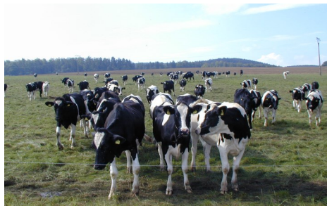
Kühe auf der Weide