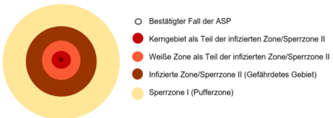
Abbildung 1: Modellhafte Darstellung einer möglichen Zonierung

Die Größe der Sperrzonen wird in Abstimmung mit der lokalen ASP-Sachverständigen-Gruppe (Vertreter/innen z.B. aus dem Veterinär-, Jagd-, Landwirtschafts-, Katastrophenschutz- und dem Wissenschaftsbereich) der Landkreise/kreisfreien Städte festgelegt. Dabei werden unter anderem die mögliche Weiterverbreitung des Erregers, die Wildschweinpopulation, Tierbewegungen innerhalb der Wildschweinpopulation, natürliche Grenzen, zäunbare Strukturen sowie Überwachungsmöglichkeiten berücksichtigt. Da es sich um ein dynamisches Geschehen handelt, muss die Lage fortlaufend überprüft und bewertet werden sowie die Gebietsgröße erforderlichenfalls angepasst werden.