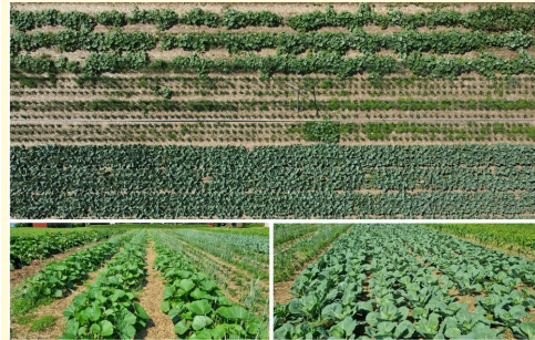
Bild 2 Oben: Drohnenaufnahme der Versuchsfläche Pappelhof 2021 mit Hokkaidokürbis, Knollensellerie und Weißkohl.