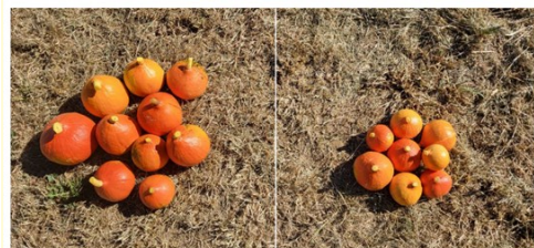
Bild 3: Geerntete Kürbisfrüchte auf dem Hof Obersteinberg 2022 von jeweils vier Pflanzen (links mit Mulch und rechts ohne Mulch)